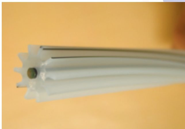
スロット Slotted Core